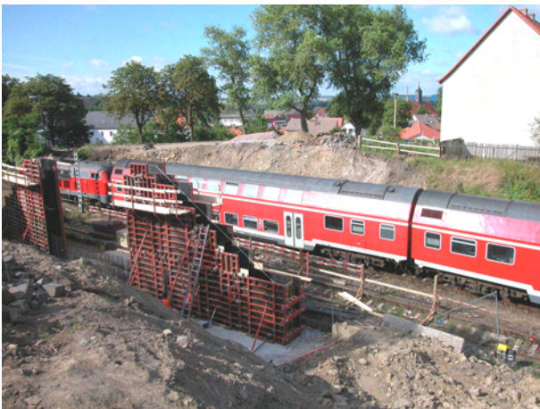
Bau der westl. Widerlagerwand, im Hintergrund eine Fußgängerbehelfsbrücke für die Zeit der Bauausführung